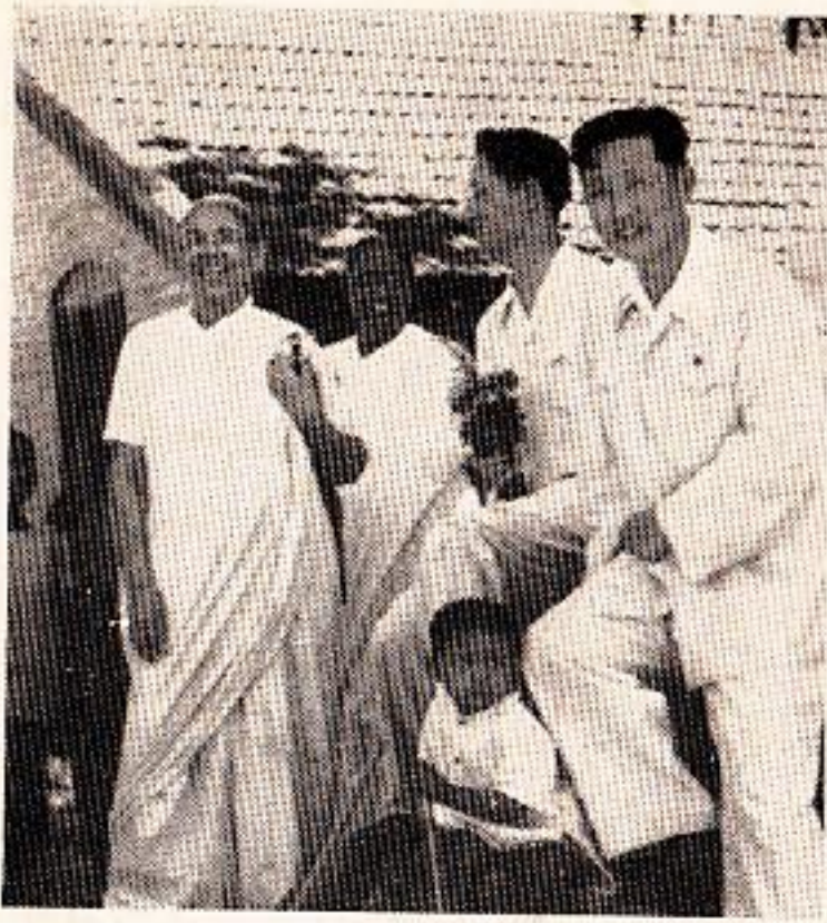
परदेशी पाहुण्यांची भेट